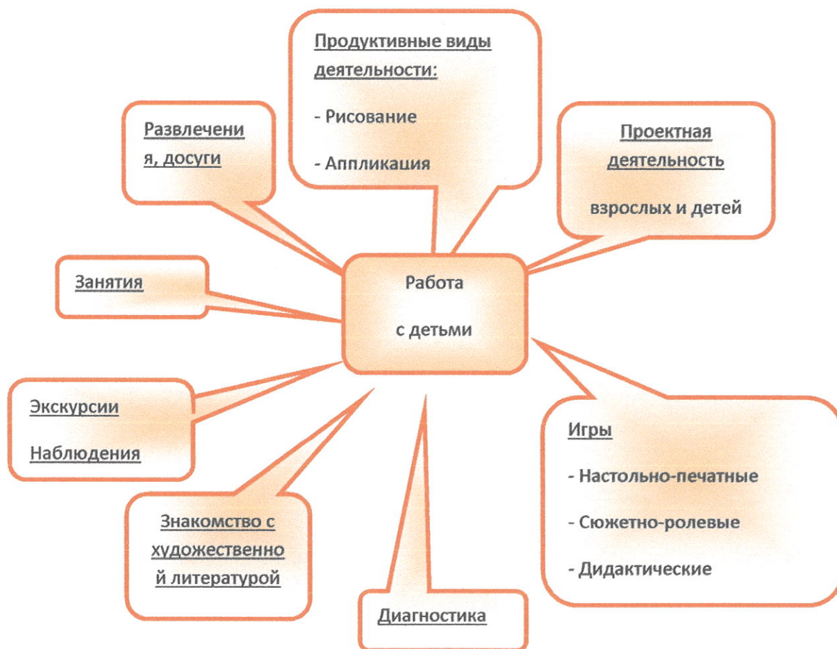
Рис.1 Формы работы с детьми по обучению безопасному поведению на дороге.

Работа в ходе реализации программы может быть специально организована, а также внедрена в обычные плановые формы работы.